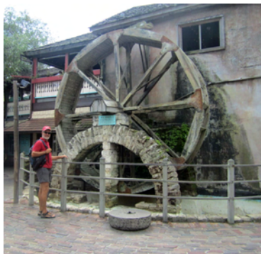
Här fanns en gång en kvarn