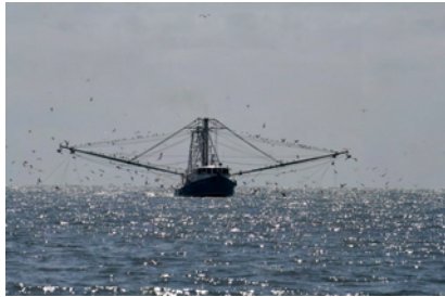
Räkträlare utanför Fernandina

Vi gjorde ännu en nattsegling, då vi passerade Georgia. Vad som alltid är lika roligt är att se allt djurliv som finns i vattnet. Denna gång mötte vi bland annat stora stim av fisk, tätt ihopsamlade till en stor svart skugga. Senapsgula rockor kom i par och i ett stort stim. Maneter och delfiner förstås och många sorters fåglar. En liten orädd fågel stannade och pustade ut en stund hos oss. Naturkrafterna är starka och det fick vi smaka på i form av regn- och åskoväder som blixtrade och smällde över oss under några timmar. Målet för vår segling var Charleston, i South Carolina, där vi kunde ankra efter 30 timmar.