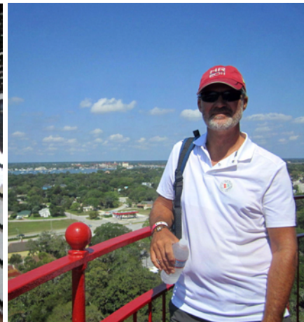
Fin utsikt är belöningen!