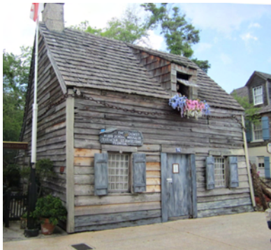
USAS äldsta skola i trä