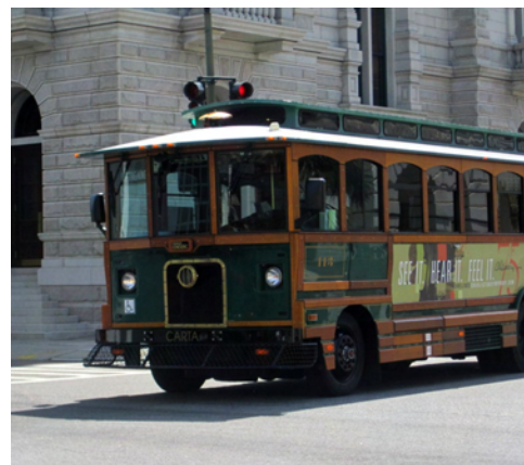
Även bussarna såg gamla ut