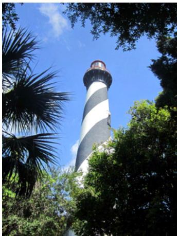
Den renoverade fyren

Aristocat lämnade oss och vi tog bussen ut till Anastasia Island, ön utanför St. Augustine. Här besökte vi fyren, som i början av 1990-talet skulle rivas, men som räddades av en grupp damer som under 1930-talet gick samman och stöttade projekt de ansåg viktiga. Idag är fyren renoverad genom deras försorg och lyser åter för alla skepp under mörka nätter. Vi klättrade förstås uppför alla de 219 trappstegen och belönades med en strålande utsikt.