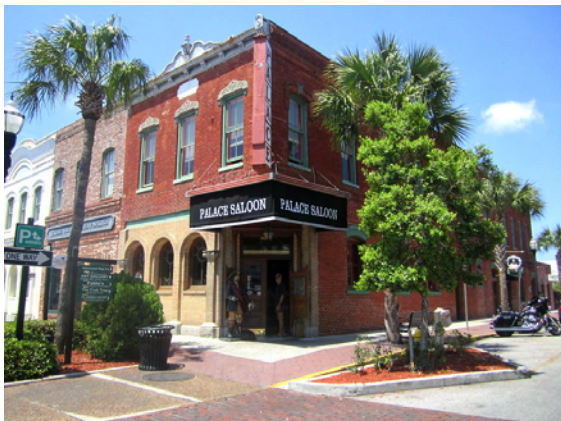
Palace Saloon, från 1878

Självklart besökte vi Palace Saloon från 1878, där man fortfarande serverar sina alldeles egna Pirate´s Punsch. Eftersom man hade livemusik var vi även där på kvällen, något vi sällan har gjort det senaste året.