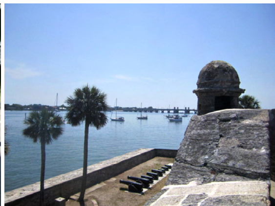
Vy från fortets tak, över vår boj och båt!