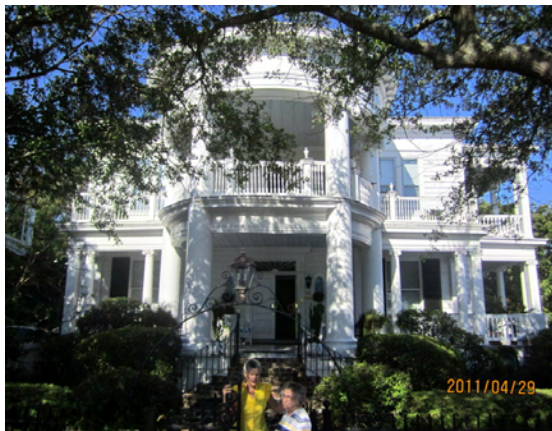
Viktorianska villor finns det också

En lustig detalj på alla dessa kolonialvillor är att den stora terrassen som bildas innanför kolonnerna användes som sovplats då det ofta blev för varmt inomhus. För att inte få "objudna" nattgäster har allt fler satt upp bastanta dörrar ut mot gatan.