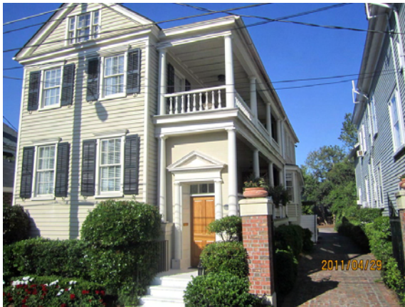
Typisk kolonialvilla, nu med dörr till terrassen

Utanför Charleston finns flera stora plantager, bland annat kan man i besöka Tara, som användes vid inspelningen av filmen "Borta med vinden".