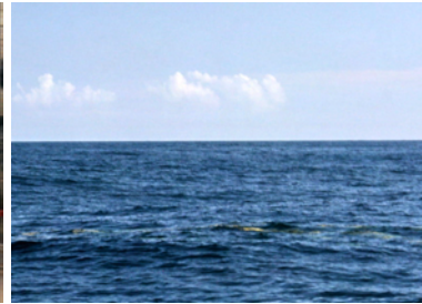
Senapsgula rockor i stim

Dagen efter började det blåsa, och med varningar om tornados, kändes det tryggt att flytta in i Charleston City Marina. Att ligga i marina i USA kostar 1-3 dollar per fot. Mer sällan bara 1 dollar, men i gengäld är det levande marinor med fullservice. Det finns alltid fräscha duschar att tillgå och en välutrustad tvättstuga. Här hade man dessutom en bil som varje timme körde in till centrum och som man kunde ringa för att bli hämtad. Suveränt! På ankarplatsen hade vi inte vågat lämna båten men nu kändes det bra att ta paus från blåsandet och kika på staden istället.