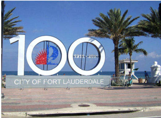
Fort Lauderdale - 100 år!

De hade haft en gård i många år, som de sålt, och är vana att leva hänvisade till varandra. Nu seglar de jorden runt och alla jobbar när de kan och bidrar till familjens försörjning. Man kan ju inte låta bli att undra hur det skall gå i framtiden. En dag fyllde pappan år och vi blev bjudna på middag. En mycket trevlig kväll då vi alla åtta pratade i mun på varandra. Något förvånade blev vi i starten då pappan bad bordsbön innan vi åt. Både jag och kapten slängde snabbt ner blicken och snurrade ihop fingrade lite lagom.