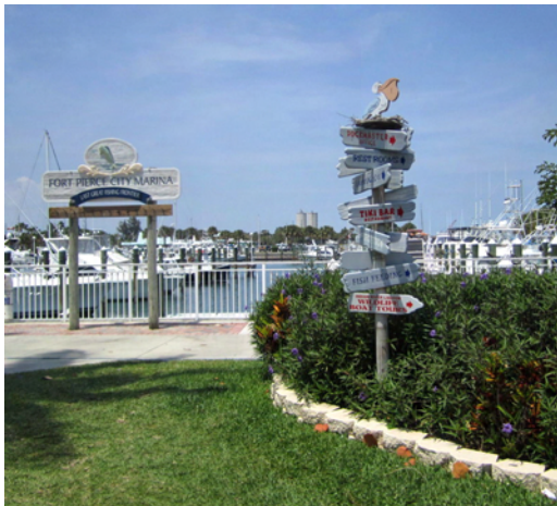
Fina skyltar i Fort Pierce marina

Vi hade seglat till Fort Pierce där vi stannade och tänkte nästa dag gå på ICW då vinden skulle bli nordlig. Tur att vi kollade innan för vi skulle inte kunna komma ut på tre dagar! När vi kom in till Fort Pierce möttes vi av en stor, svart rocka som hoppade ca en halv meter ovanför vattenytan, mäktigt!