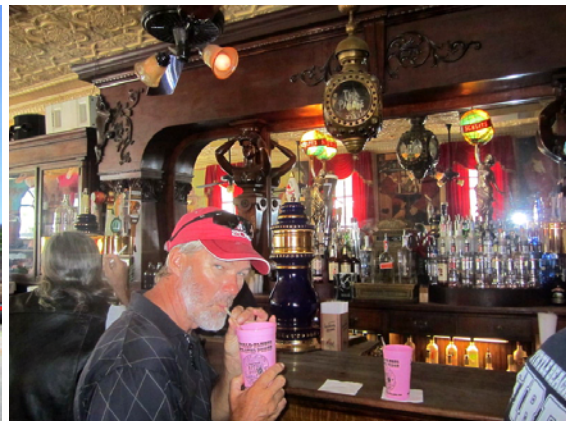
Här serveras starka och goda! Pirate´s Punsch