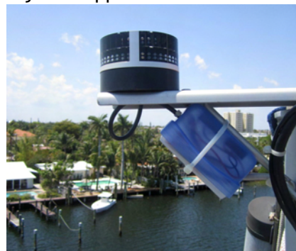
Ny Lopolight på plats - igen!