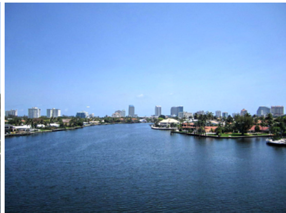
Och österut, mot hotellen, stranden och havet

Äntligen på plats i Amerika och nu började vi pricka av på vår lista med vad som skulle göras eller köpas. Det första vi ville fixa var telefon- och Internetabonnemang. Inte så lätt att göra som det låter. Säljare är ju alltid säljare, och först ville man sälja på oss ett käckt paket med två telefonnummer och snabbt Internet med 4G, för "bara" 200 US$ per månad. I slutändan gick det inte alls för om du inte har en fast adress och ett socialförsäkringsnummer är du en mycket suspekt person här. Telefon var inget större problem, det finns ju kontantkort. 4G-modemet fick vi köpa men det fungerade inte för det finns ingen tjänst