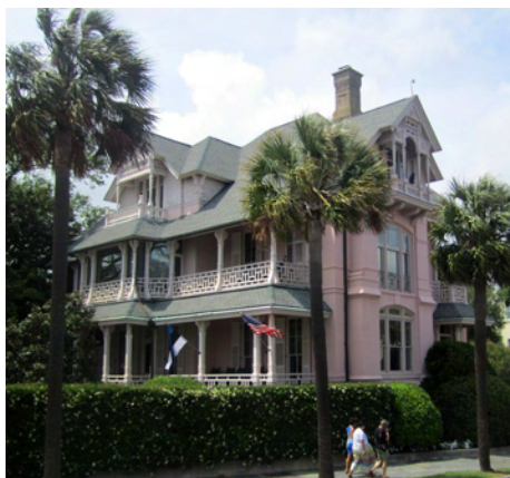
Villor i kolonialstil

Charleston grundades 1670, och uppkallades efter Karl II av England. Här bor ca 100 000 personer och hela innerstaden är som ett museum. Alla hus är antingen gamla, och i fint skick, eller nybyggda i gammal stil. Så sent som i början på 1990-talet fanns här en hel del slum så man har gjort ett fint arbete med staden på ganska kort tid. Vi hittade en liten buss som gick runt de centrala delarna. Av någon anledning var den dessutom gratis så vi åkte med ett varv och kikade på många fina byggnader i kolonialstil. Sen traskade vi själva genom små gränder, in och ut i små affärer, besökte en hantverksmarknad och hittade en trevlig irländsk pub.