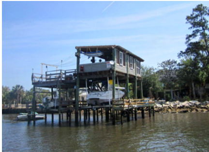
Ett av många båthus längs ICW

När det var dags att åka tillbaka frågade vi busschauffören om han skulle kunna släppa av oss vid den lilla mataffären vi sett på vägen ut. Inga problem, löd svaret. Men först skulle vi köra till slutstationen och vända. Då frågade chauffören om vi verkligen vill handla i den lilla affären, det fanns ju en stor Publix bara någon kilometer bortanför sista hållplatsen. Det slutade med att denne vänlige man körde oss till den affären, Publix, och dessutom kom och hämtade oss en timma senare!