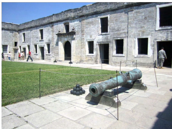
Borggården på Castillo de San Marcos

Följande dag startade vi på Castillo de San Marcos, USA:s äldsta och största stenfort som byggts av spanjorer under åren 1672-1695. Mycket väl bevarat. 1740 kom britterna hit och efter häftiga strider tog de över fortet fram till 1783 då spanjorerna återkom. Florida var spanskt ända fram till 1821 då det införlivades med Amerika.