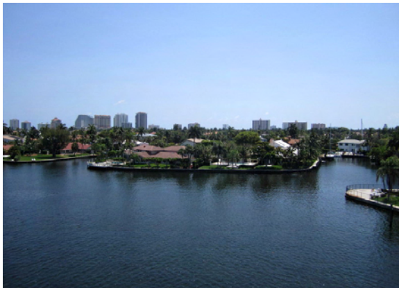
Utsikt från vår mast: Söderut, med fina villor

Strax bortanför ligger båttillbehörsaffären West Marine där kapten gärna hälsar på.