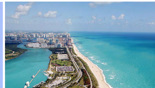
Intracoastal till vänster - Atlanten till höger