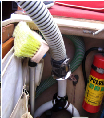
Pumpout! Det fungerar.