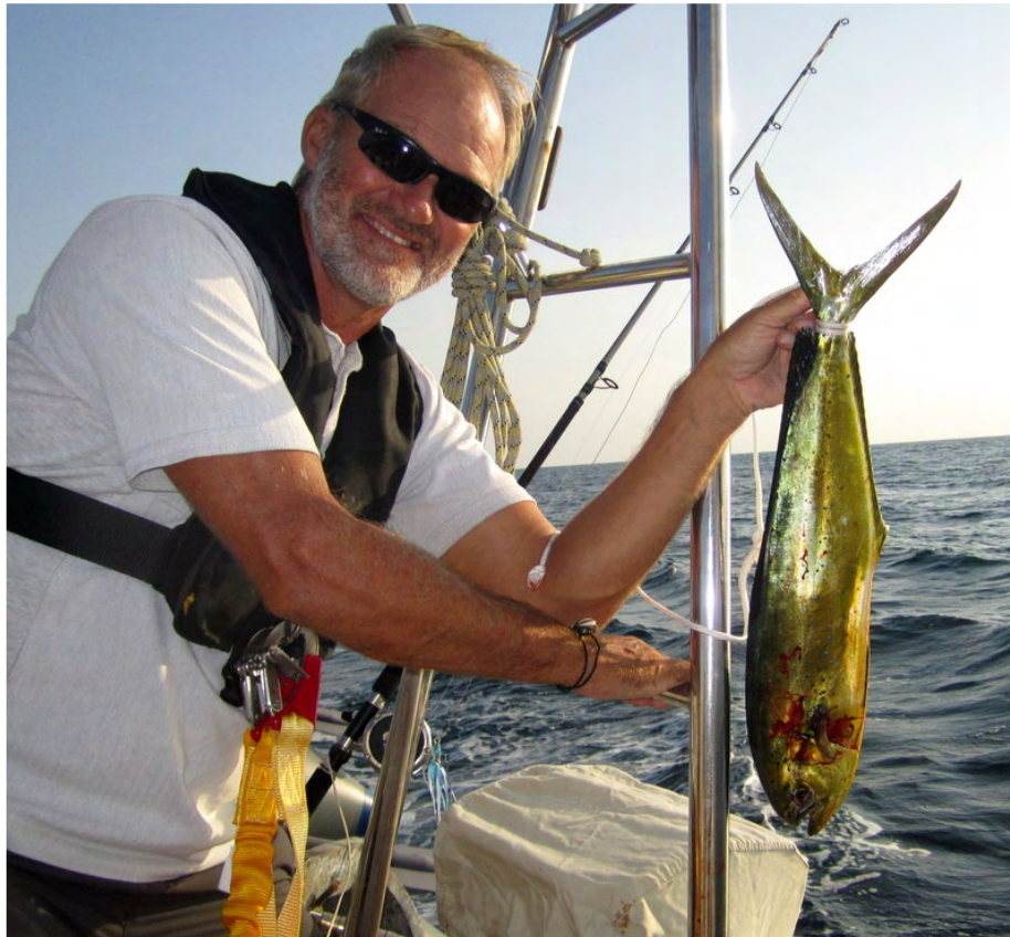
Man kan förstå varför de kallas för guldmakrill! (Eller Dorado, Mahi-Mahi, Dolphin fish osv. Kärt barn har många namn!)