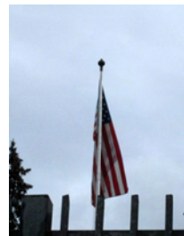
Vid ambassaden i Stockholm

Kändes ganska snopet efter att ha skickat in en massa papper och sedan åkt dit, gå fram till luckan, hålla upp fingrarna mot en apparat och sedan åka hem. Men visum är ett absolut måste om du skall komma till USA i båt.