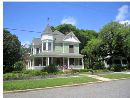
Typisk villa i Queen Anne-stil

Fernandina Beach ligger på Amelia Island som även kallas för de 8 flaggornas ö. Fransmän, spanjorer, engelsmän och slutligen amerikaner har alla, i olika tidsepoker, velat styra här. Och pirater förstås. Ön hade sin storhetstid mellan 1875-1900 då man kunde åka med ångbåt från New York till Amelia Island. Byn växte explosionsartat och trots en brand 1876, finns många byggnader kvar och flera återuppfördes. Bara ett stenkast från huvudgatan i centrum ligger de gamla fina trävillorna i Queen Anne-, Chippendal- och italiensk stil och de flesta bebos än idag av helt vanliga familjer.