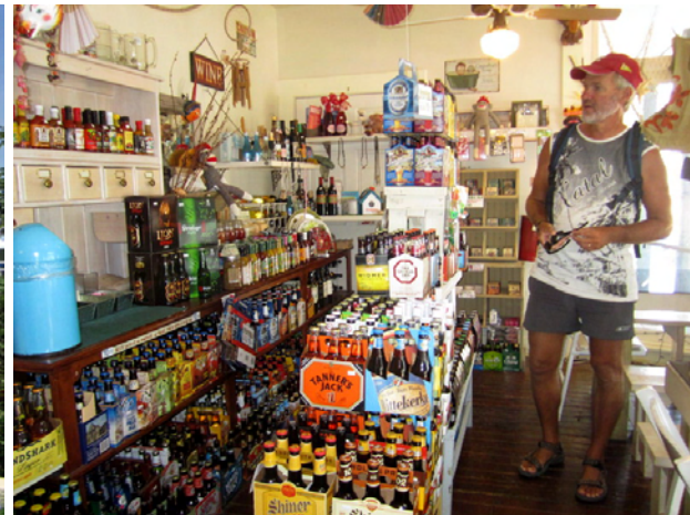
Kapten har svårt att välja hos P.P. Cobb

Det blev en heldag i Fort Pierce, vilket visade sig vara en trevlig liten stad, helt utan turister. Längs strandpromenaden pågick en fin hantverksmarknad, som vi besökte. Massor av folk och en orkester som spelade. Vi tog dingien in till marinan och strax ovanför denna låg downtown, som var mycket prydligt och fint iordninggjort. Här hittade kapten butiken P.P. Cobb och fick sitt lystmäte då hyllorna i denna gamla butik dignade av olika ölsorter. Det blev ju inte sämre av att vi kunde beställa gott, nybakat bröd att hämta nästa morgon. Dagen avslutades på en av de mysiga restaurangerna som omgav marinan och med besök på Fort Pierce Manatee Center. Det är något vi spanar efter, manateer, det vill säga sjökor. De trivs på Intracoastal som är lagom djupt för dem och med massor av sjögräs att äta.