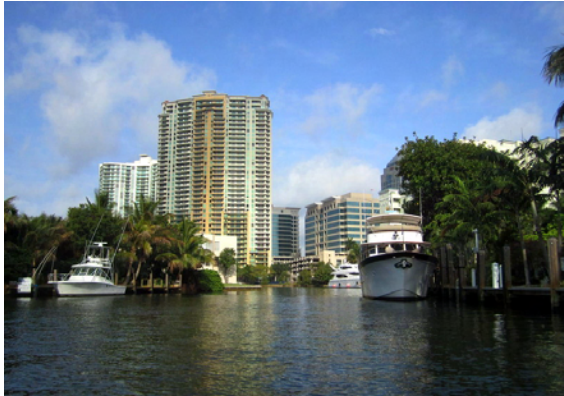
New River i Downtown, Fort Lauderdale

Vi gjorde en fin dingetur in till Rivertown Ft. Lauderdale, alltså centrum. På bara 30 minuter, med vår långsamma motor, var vi framme och kunde njuta av hur fint man gjort med strandpromenader och landningsbryggor för småbåtar. Bara ett kvarter innanför ligger Las Olas Boulevard, som är den stora shoppinggatan här. Tyvärr visade det sig vara väldigt exklusivt då gatan kantades av gallerier, fina modebutiker och mäklarkontor. Det är också här man finner stadens kulturella centrum med teatrar, museum & liknande.