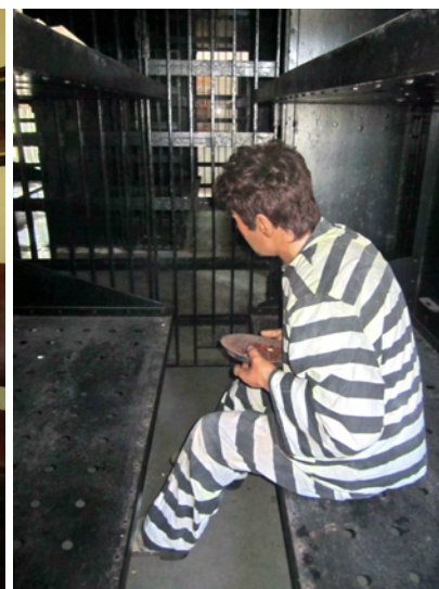
Här bodde fyra man!