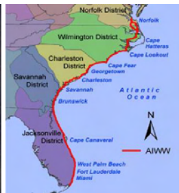
ICW längs Atlantkusten